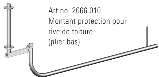
Art.no. 2666.010 Montant protection pour rive de toiture (plier bas)

La longueur maximale de la moise (garde-corps) entre deux montants du garde-corps est de 3,07 m. Les blocs de lest empêchent le basculement des montants du garde-corps sur la rive de toiture.