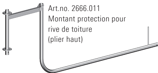
Art.no. 2666.011 Montant protection pour rive de toiture (plier haut)